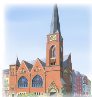
ZWINGLIKIRCHE Rudolfstraße 14, 10245 Berlin