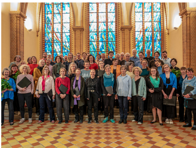
Die Friedrichshainer Chöre