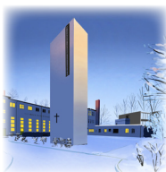
LAZARUS-HAUS Marchlewskistraße 40, 10243 Berlin