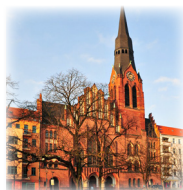
PFINGSTKIRCHE Petersburger Platz 5, 10249 Berlin