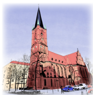
SAMARITERKIRCHE Samariterplatz, 10247 Berlin