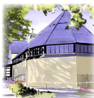
OFFENBARUNGSKIRCHE Simplonstraße 31-37, 10245 Berlin