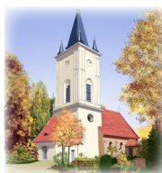
DORFKIRCHE STRALAU Tunnelstraße 5-11, 10245 Berlin